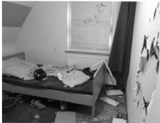
Abbildung 1: Wenn Alltagskonflikte in gewaltsamen Eskalationen enden, sind oft nicht nur die Eltern ohnmächtig...

antizipieren konnten. Und der zweite Faktor, der Eltern wie Fachkräfte betrifft, bezieht sich auf die sozialen Konsequenzen des Verhaltens. Die Befragten sowohl im qualitativen Setting als auch in dem Online-Survey bewerteten wesentlich stärker, ob Dritte die Situation mitbekommen haben und es zu einer sozialen Beschämung kam, als nach der konkreten Schädigung für den Elternteil.